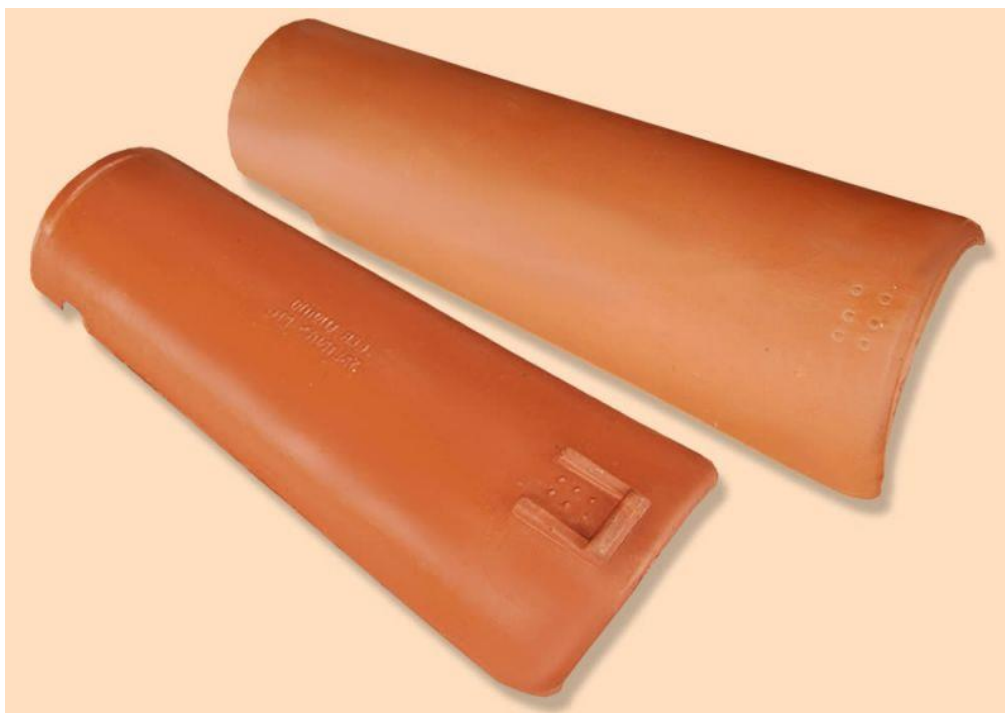
Figura 2 - Telha colonial paulista

A inclinação das telhas será no mínimo de 25% e no máximo de 30%, devendo obedecer ao projeto arquitetônico.